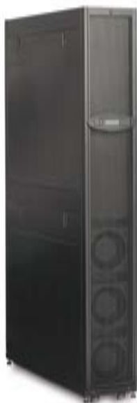
Klimasystem: APC InRow SC