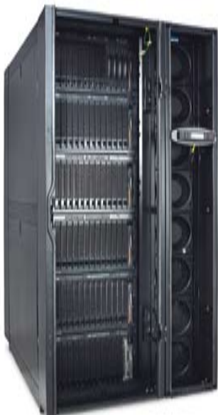
Racksystem: APC NetShelter mit InRow SC

Menschen mit Behinderungen in die Gesellschaft zu integrieren und ihnen ein selbst bestimmtes Leben zu ermöglichen – das ist das Ziel der Heilerziehungs- und Pflegeheime Scheuern. Mit ihren 650 differenzierten Wohnstätten und den 430 Arbeitsplätzen der „Langauer Mühle“ orientiert sich die gemeinnützige Stiftung des Bürgerlichen Rechts an individuellen Bedürfnissen ihrer Bewohner/-innen. Zur Unterstützung ihrer 690 Mitarbeiter/innen betreibt die seit 150 Jahren bestehende und bei Nassau gelegene Stiftung eine moderne und zuverlässige IT-Umgebung, die rund 160 IT-Arbeitsplätze an sechs Standorten beinhaltet. Die Verfügbarkeit der darüber bereitgestellten EDV-Anwendungen und damit den laufenden Betrieb der Stiftung sichert seit Januar 2007 eine neue Infrastrukturlösung ab.